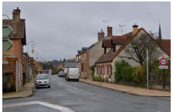
Rue de la poste